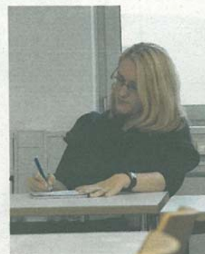
Rechnen? Wie ging das? Die Autorin im VWL-Seminar.